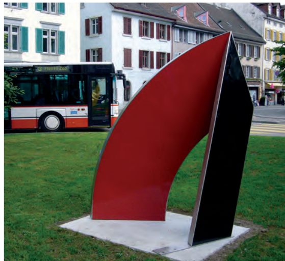
Pentagon-Konstellation an der Promenadenstrasse in Frauenfeld (gegenüber Regierungsgebäude)